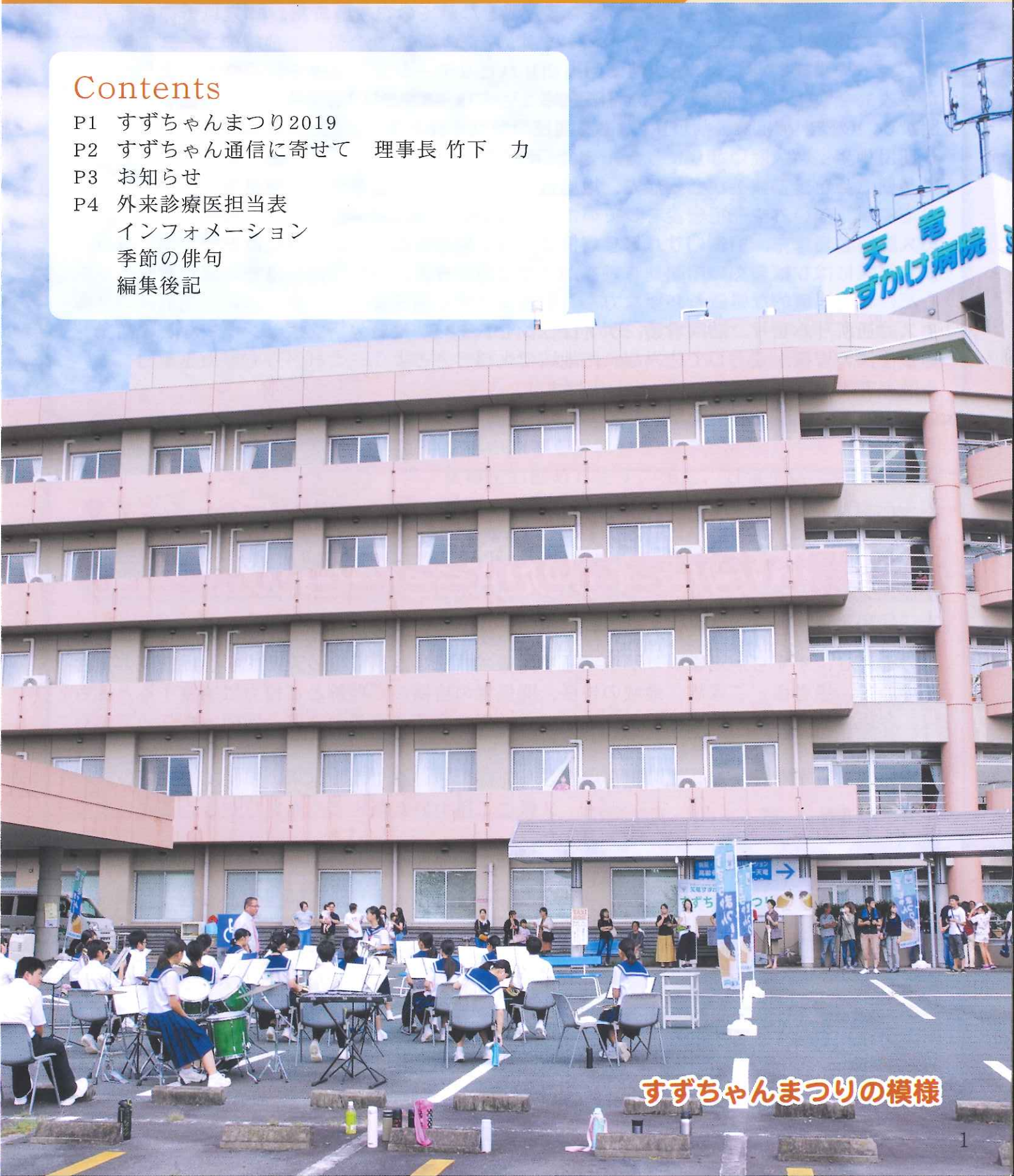
すずちゃんまつりの模様