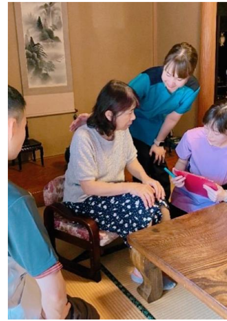
退院前後訪問指導