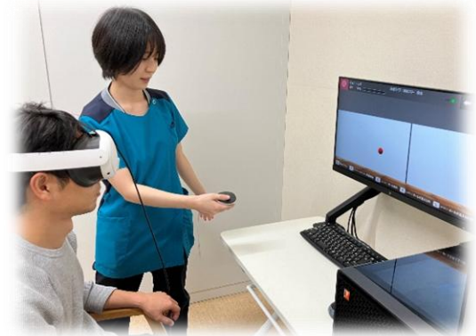
STELA(ステラ)/KOTOREHA(コトリハ) 言語機能評価システム、言語訓練支援アプリ