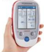
postim / NESS H200 / NESS L300