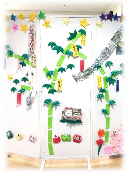
季節を感じるレクリエーション