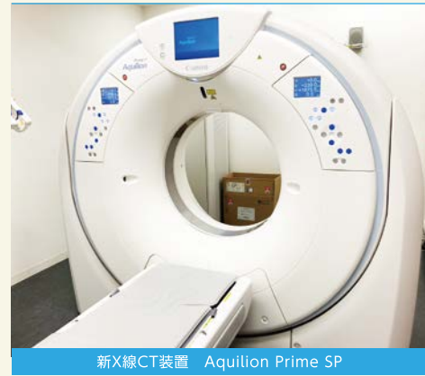
新X線CT装置 Aquilion Prime SP