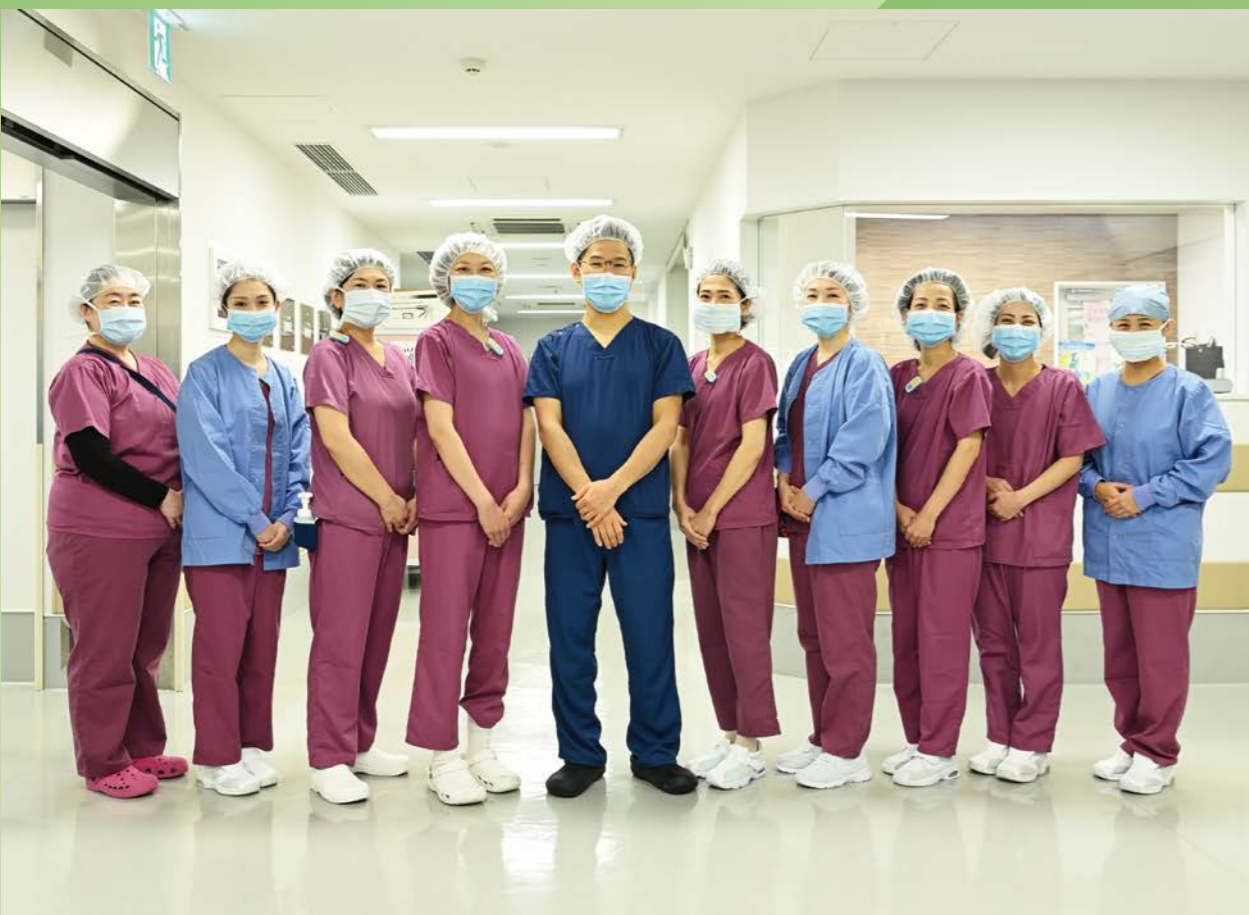
| 表紙 | すずかけセントラル病院 手術室スタッフ