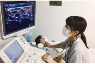
超音波検査を行う検査技師

身体に超音波を当てて各種臓器の状態を反射波で診ます。腫瘍、炎症、結石など異常のほか、各種生検の時にエコーにて穿刺場所を特定することにも役立っています。 当院には五名の超音波認定技師が在籍しており、毎年合格者を輩出しています。