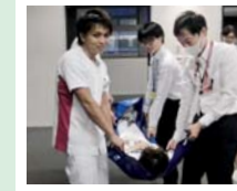
▲ターポリン担架による負傷者の避難誘導

平成30年11月7日(水)に、東南海沖地震発生、津波警報発令を想定した防災訓練を実施しました。夜間災害発生時でも適切で迅速な対応が出来る事を目的とし、在院患者の安全確認と安全確保、状況報告訓練、ターポリン担架での避難誘導、エレベーター故障時の救助訓練等を行いました。津波避難ビルに指定されている当院では、職員が積極的に防災訓練に参加しております。