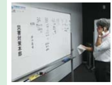
▲院内の安全状況確認のため、災害対策本部を設置