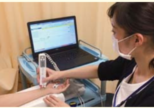
筋電図検査を行う検査技師

筋肉の運動障害、脱力、痛みなどの原因が筋肉によるものか、筋肉を動かしている神経によるものかを鑑別します。 また、障害部位、程度などを判定します。