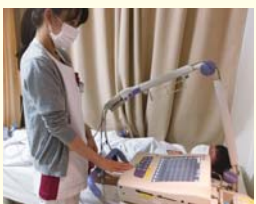
心電図検査を行う検査技師

健康診断や人間ドックを受診される際に、血液検査、尿・便検査、心電図、超音波検査、眼底写真検査などが必要不可欠となりますが、これらを臨床検査技師が行っています。 また健診バスにて企業に向き、現場で心電図検査や採血業務を行っています。医師、看護師、放射線技師、事務スタッフと連携を取り、受診者さんが安心して各種検査を受けて頂けるよう心掛けています。