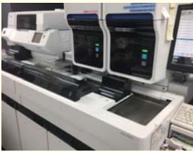
シスメックス血算機器

患者さんから採血して得られた血液中の成分である赤血球、色素から貧血程度、白血球の多さから炎症の程度や白血病などを診断します。