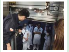
▲エレベーター故障時の救助訓練