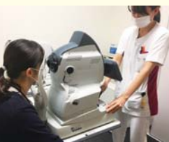
眼底検査を行う検査技師